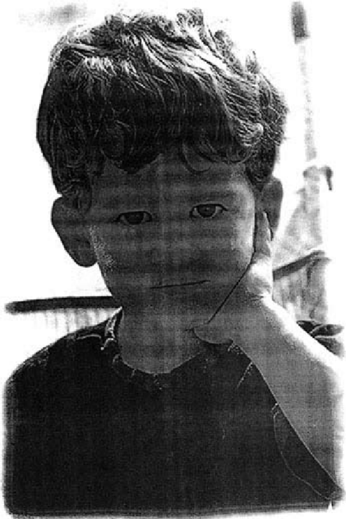
The 21st Century Learning Initiative

The 21st Century Learning Initiative www.21learn.org www.ccl-cca.ca/apprentissage21siecle